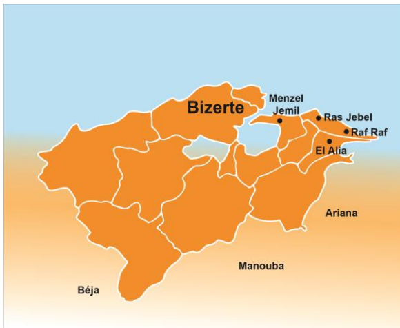
La zone de Ras Jebel, Raf Raf, El Alia et Menzel Jemil dans le gouvernorat de Bizerte

Zones géographiques : Le projet pilote se déroule dans quatre territoires à forte activité migratoire, identifiés de manière collégiale sur la base de critères sociodémographiques. Les autorités locales sont partie prenante du bon déroulement.