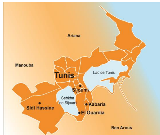
La zone de Kabaria, El Ouardia, Sidi Hassine et Sijoumi dans le gouvernorat de Tunis

Contact : +216 29 530 385 - kais.mnasri@ofii.fr